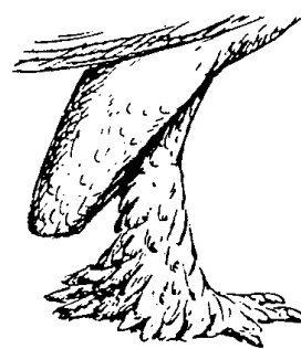
Fußbefiederung und Geierfersen

Als Fussbefiederung wird die Ausbildung von Federn an den Füßen des Geflügels bezeichnet, sie tritt immer gleichzeitig mit der Befiederung des Laufes (Beines) auf. Bei ausgeprägter Befiederung spricht man von Latschen.