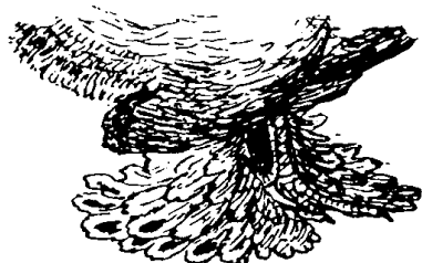
Fußbefiederung mit Stulpen und Latschen

Zur Fussbefiederung braucht man den Lauf, in der Fachsprache steht dieser Begriff für die allgemeine Bezeichnung für den Teil des Fusses zwischen Fersengelenk und Zehen. Am Lauf liegt der Fussring und männliches Geflügel trägt am Lauf die Sporen.